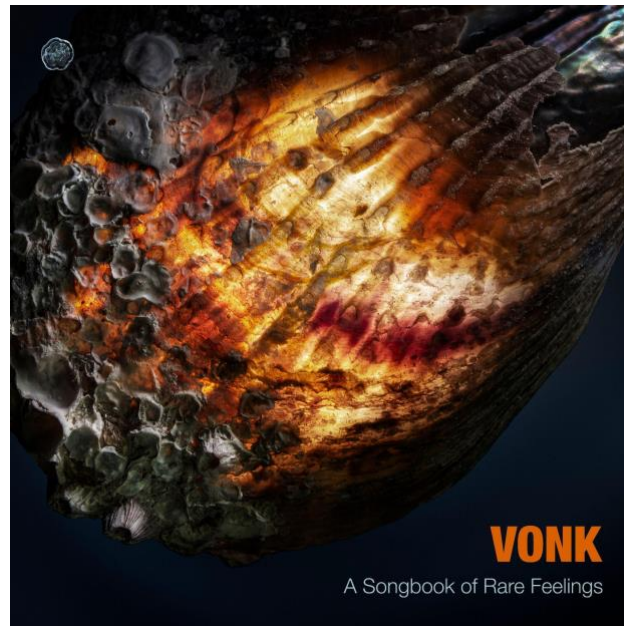
Album cover, artwork Brett Meredith

Hoogtepunt van het jaar was de release van het album A songbook of rare feelings in samenwerking met SONNA Records. A songbook of rare feelings is sinds de release te horen geweest bij Podium op Zaterdag, NTR Radio 4, De Ochtend van 4 op NPO Klassiek en VPRO Vrije Geluiden.